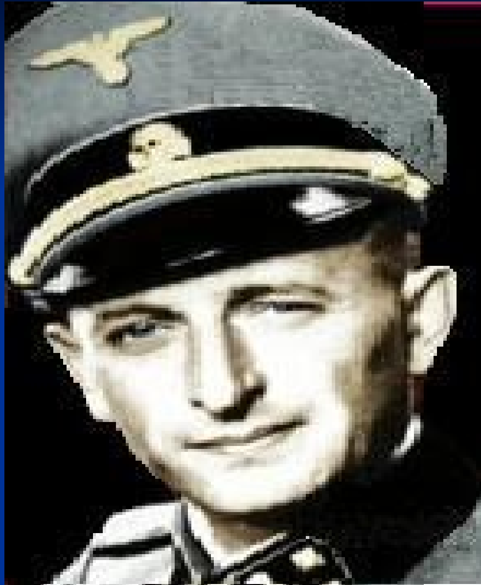
Karl Adolf Eichmann